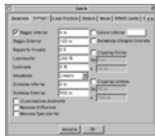
Passo 2. GreenVis Dettagli