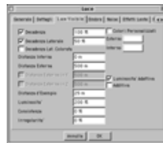
Passo 2. GreenVis Visibile