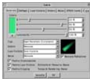
Passo 2. GreenVis Generale