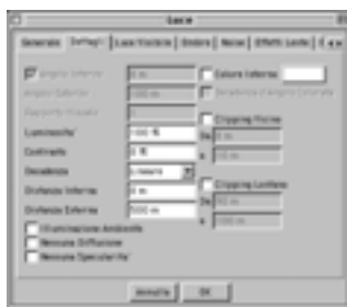
Passo 2. Green Dettagli

Andare su Dettagli ed impostare la Decadenza su Lineare. Questo assegnerà alla luce una sfumatura uniforme. Clic su OK.