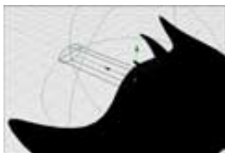
Passo 3. Luci Green